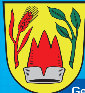
Gemeinde Stephans- posching